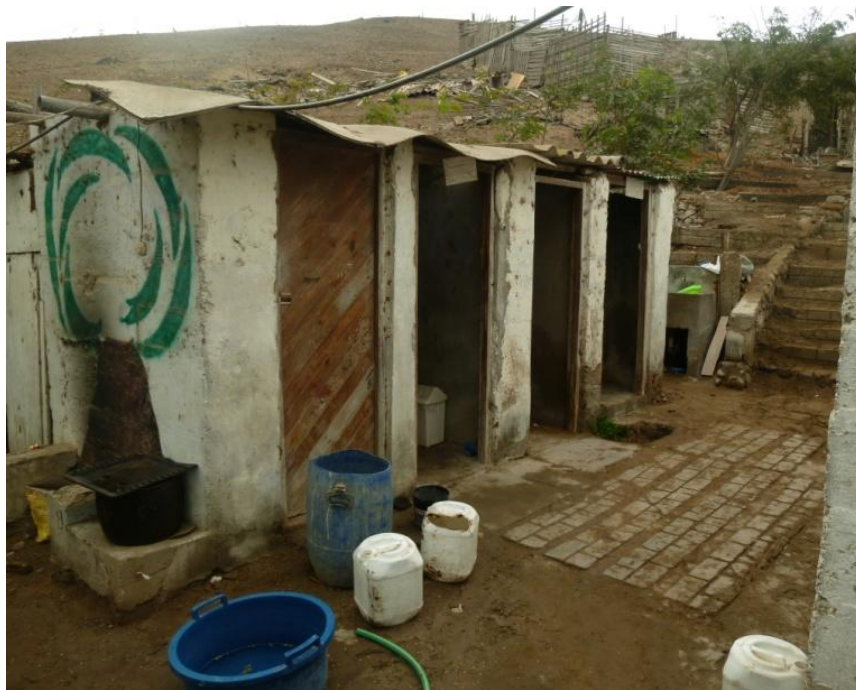
La salle de bain

Ici nous n'avons pas d'eau potable au robinet. Nous devons faire bouillir l'eau avant de la boire Nous n'avons pas d'eau chaude mais nous avons l'électricité. Il n'y a pas de machine à laver ni de télévision. Il est assez compliqué d'avoir internet !