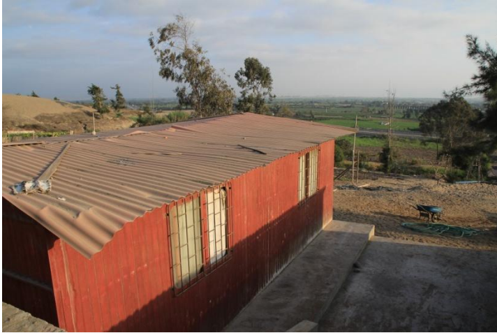
Les classes où nous travaillons avec les enfants